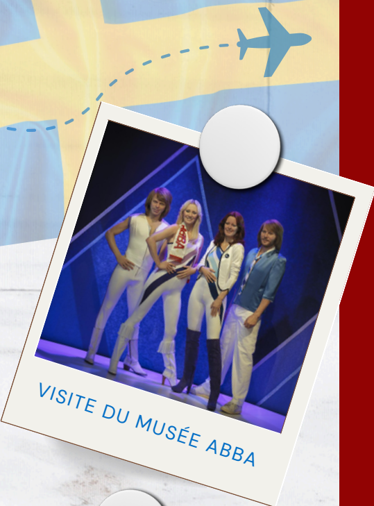
VISITE DU MUSÉE ABBA