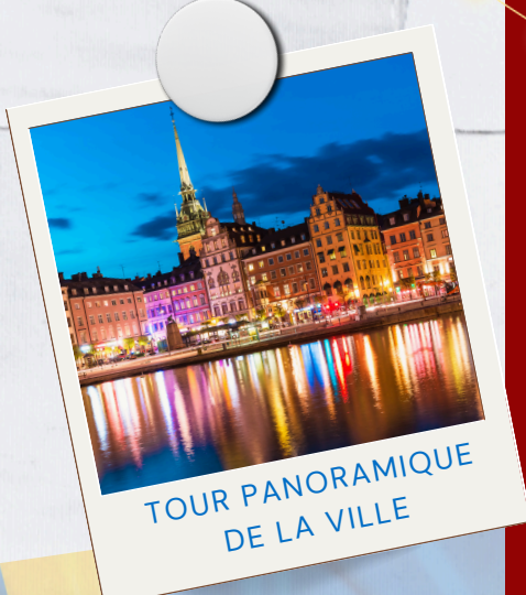
TOUR PANORAMIQUE DE LA VILLE

Tarif valable pour un minimum de 10 participants, base 30 participants regroupés. Stock limité à 40 participants par date.