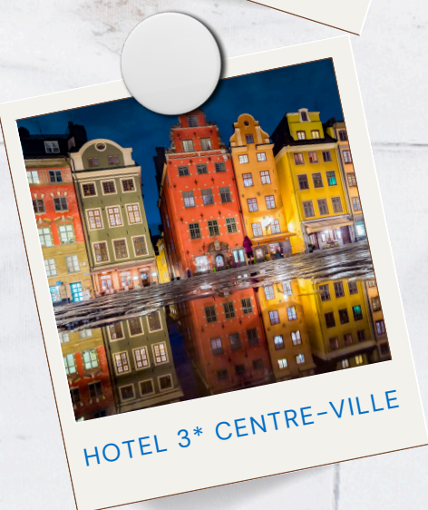
HOTEL 3* CENTRE-VILLE